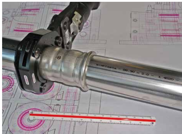
Abb.1: Edelstahlrohr aus Werkstoff 1.4520 für Heizung und andere geschlossene Wasserkreisläufe; speziell angepasster Pressverbinder mit Piktogramm „kein Trinkwasser“

K upfer hat nach dem Preiseinbruch im Zusammenhang mit der Krise 2008 bereits wieder das vorher vorhandene Niveau erreicht und zeitweise sogar überschritten. Sicherlich war diese Preisentwicklung auch unterstützend bei der Entscheidung einiger Kupferrohranbieter, die Wanddicken ihrer Rohre für die Haustechnik zu verringern, um somit Werkstoff zu sparen. Im Bereich der metallischen Alternativen für Heizungen im Bauwesen ist es besonders das dünnwandige Stahlrohr mit den zugehörigen Pressverbindern, das sogenannte „C-Stahl-System“, das einen deutlichen Marktanteil gewonnen hat. Dieses System aus Kohlenstoffstahl ohne nennenswerte Legierungsanteile bietet jedoch bei Verlassen der vorgeschriebenen Installations- und Betriebsweise nur geringe Reserven gegen Korrosionserscheinungen und wird schon in anderen Fachbeiträgen kritisch betrachtet. So häufen sich laut einer im Dezember 2011 erschienenen Veröffentlichung vom Institut für Schadenverhütung und Schadenforschung der öffentlichen Versicherer e.V. Korrosionsschäden mit C-Stahlrohren aus der Heizungsinstallation.